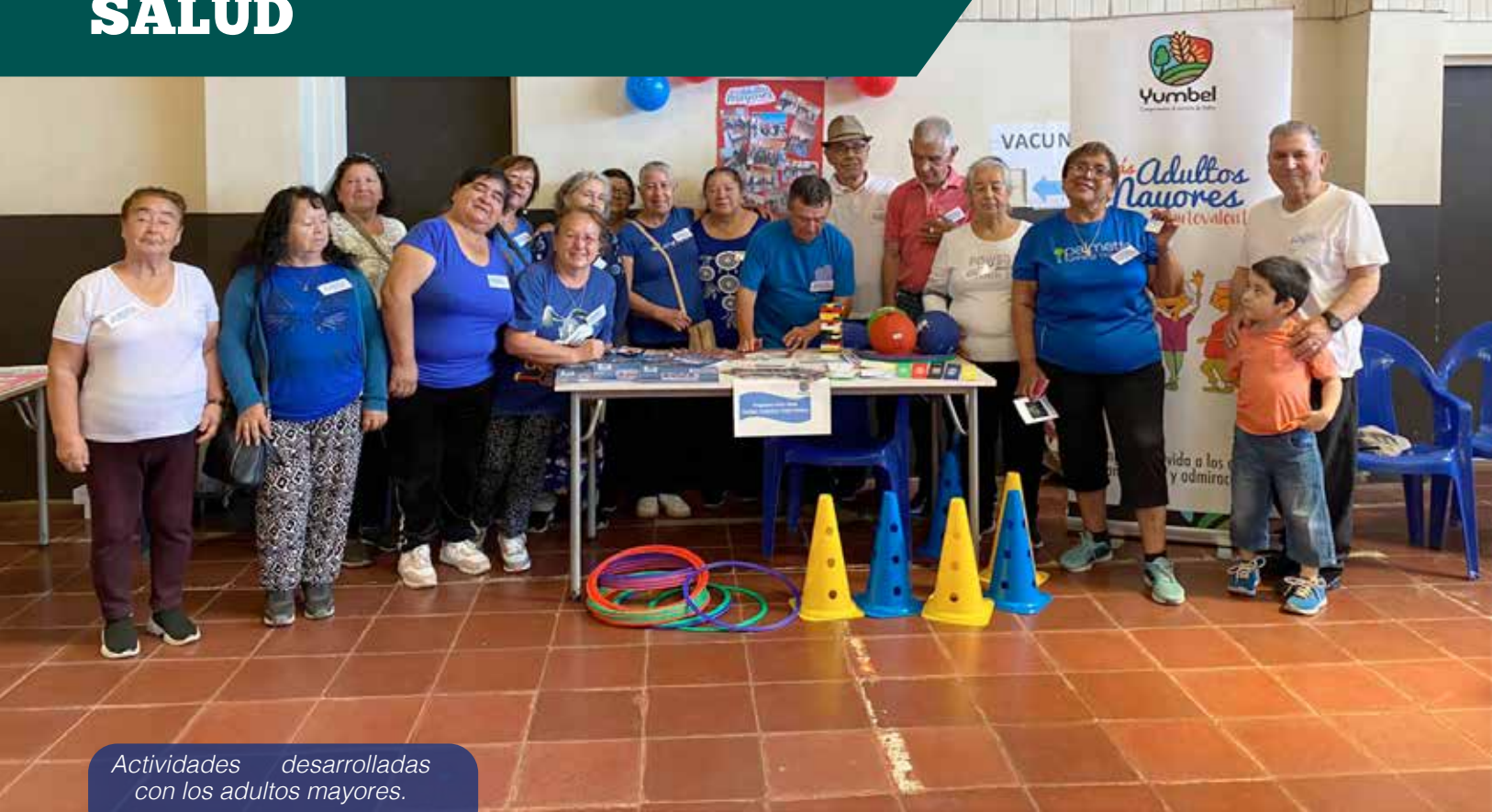
Actividades desarrolladas con los adultos mayores.