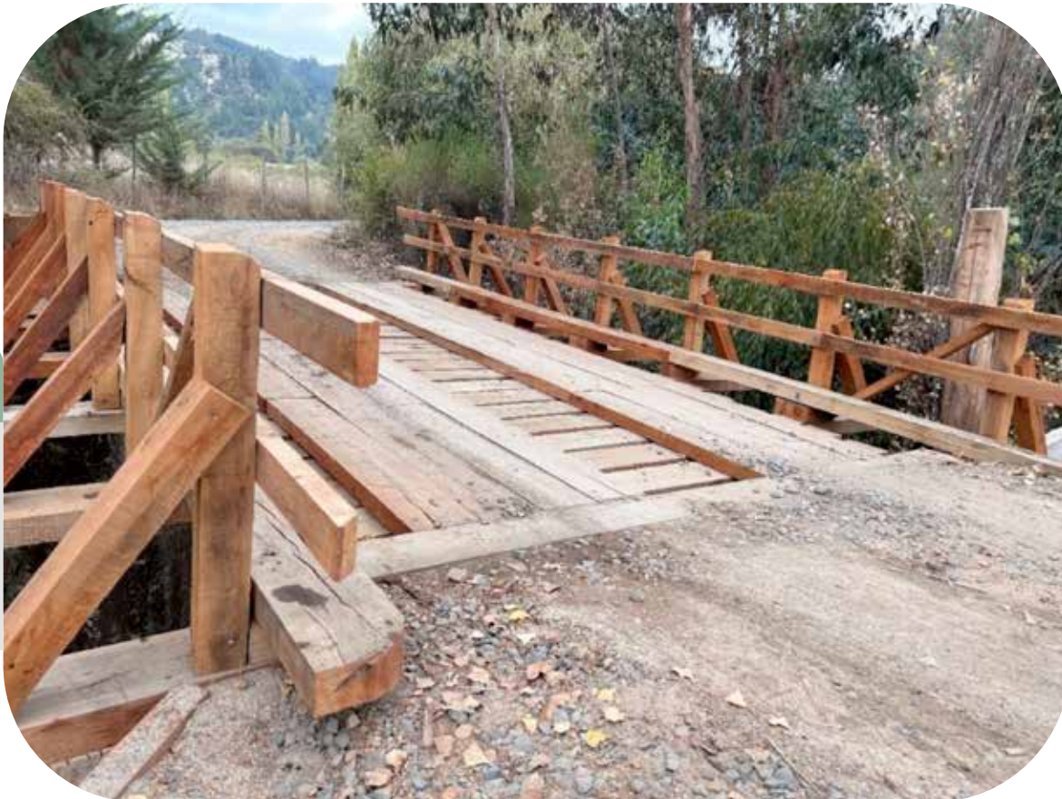
Construcción baños públicos sector centro, Yumbel.