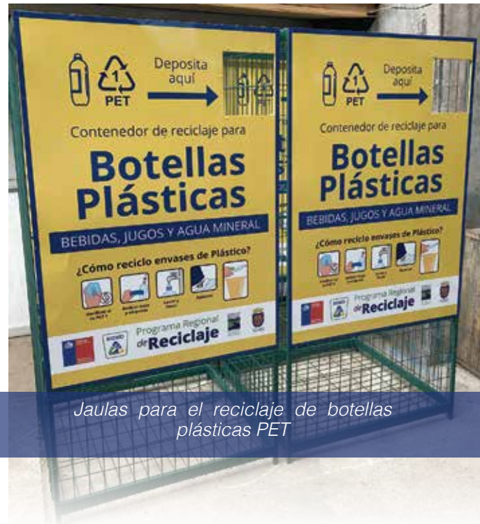
Jaulas para el reciclaje de botellas plásticas PET