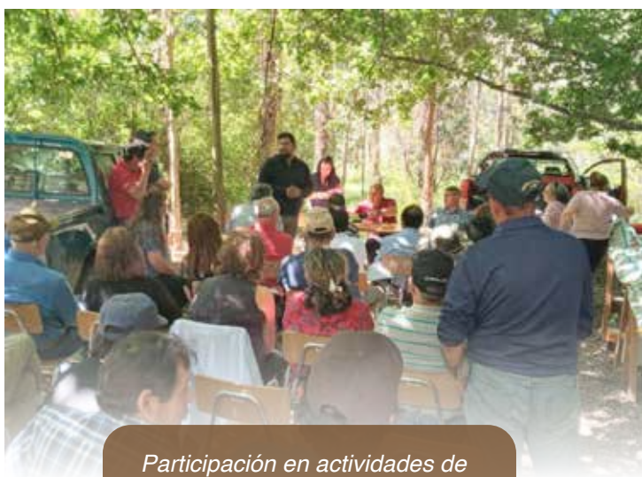
Participación en actividades de Juntas de Vecinos