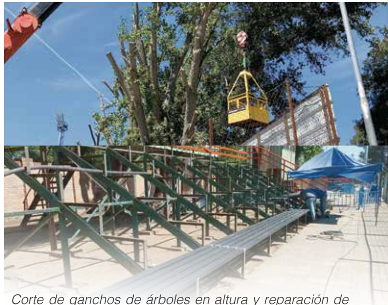
Corte de ganchos de árboles en altura y reparación de graderías en estadio municipal de Yumbel, fondos municipales