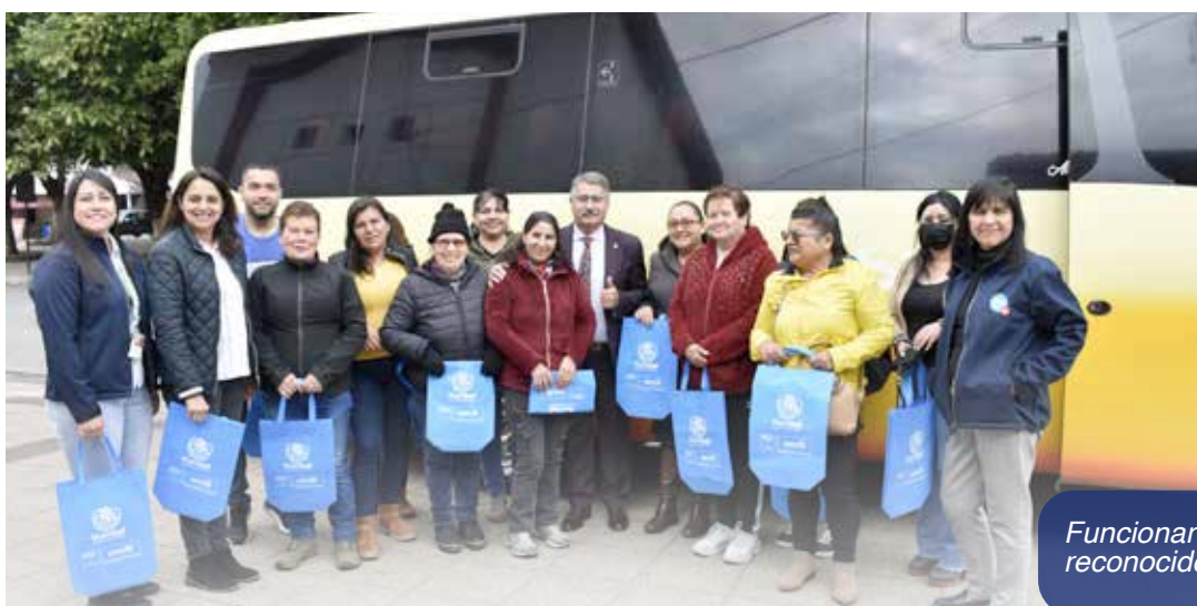
Funcionario OMIL reconocidos a nivel provincial