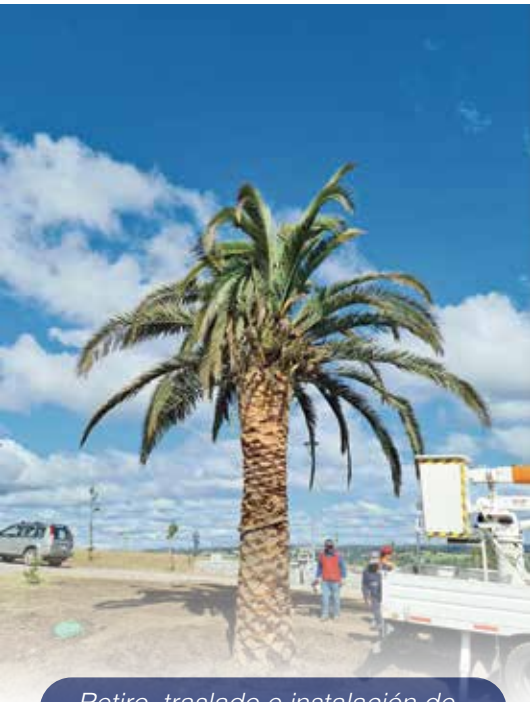
Retiro, traslado e instalación de palmera en parque urbano "Cerro La Virgen", donada por vecino yumbelino