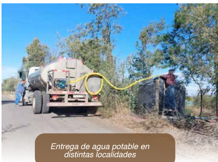
Entrega de agua potable en distintas localidades

La Dirección de Seguridad Pública, Protección Civil y Emergencias, tiene por objetivo implementar planes y acciones de gestión del riesgo de desastre en el territorio comunal, tal como se enuncia en la Ley 21.364, que crea el Sistema Nacional de Prevención y Respuesta ante Emergencia. Así mismo, está a cargo de la implementación de la Ley 20.965, que crea planes y Consejos comunales de seguridad pública.