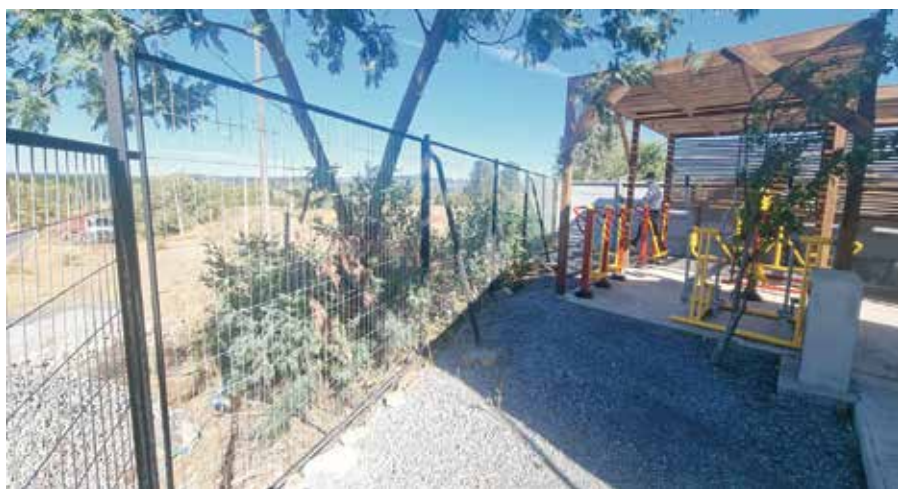
Construcciones y reparaciones en las distintas postas y Cesfam de la comuna, relacionadas con la calefacción, acceso universal, máquinas de ejercitación.