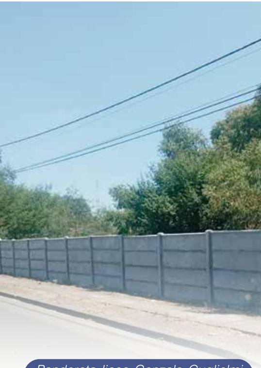
Pandereta liceo Gonzalo Guglielmi de Estación Yumbel

El mejoramiento de los espacios educativos es una prioridad para el sistema, para ello, se han elaborado y postulado a mejoramiento de infraestructura al Liceo Luis Saldes, escuela Héroes de Chile, además de inicio de ejecución de proyecto de conservación en Rere por 288 millones; sello verde en escuela Diego Portales y Sala Cuna Rayito de Luz.