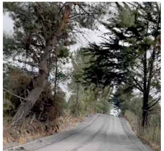
Construcción carpeta de camino básico Rere Los Despachos (MOP VIALIDAD)