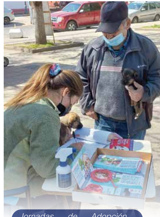
Jornadas de Adopción de perros proveniente del Canil Municipal y canes con situación de calle