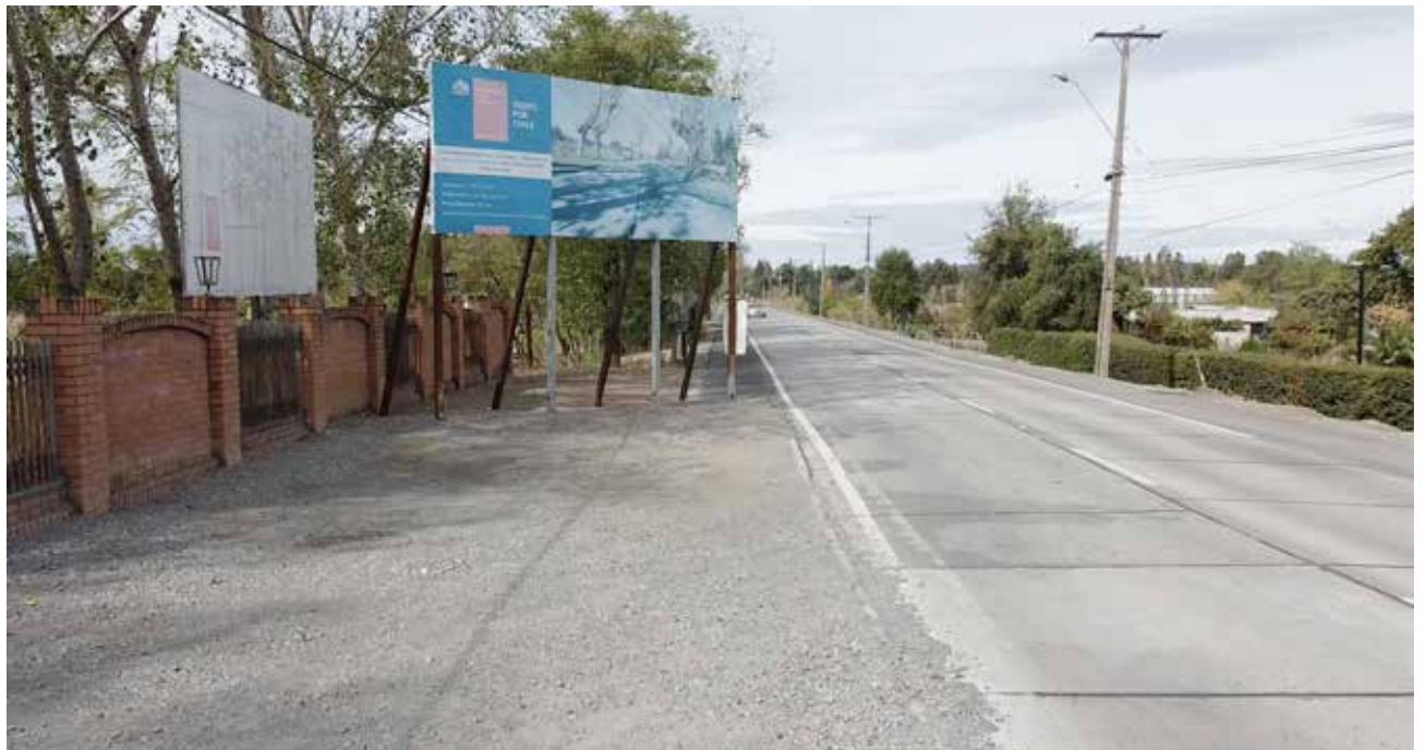
Mejoramiento del camino Estación Yumbel – balneario Rio Claro MOP VIALIDAD