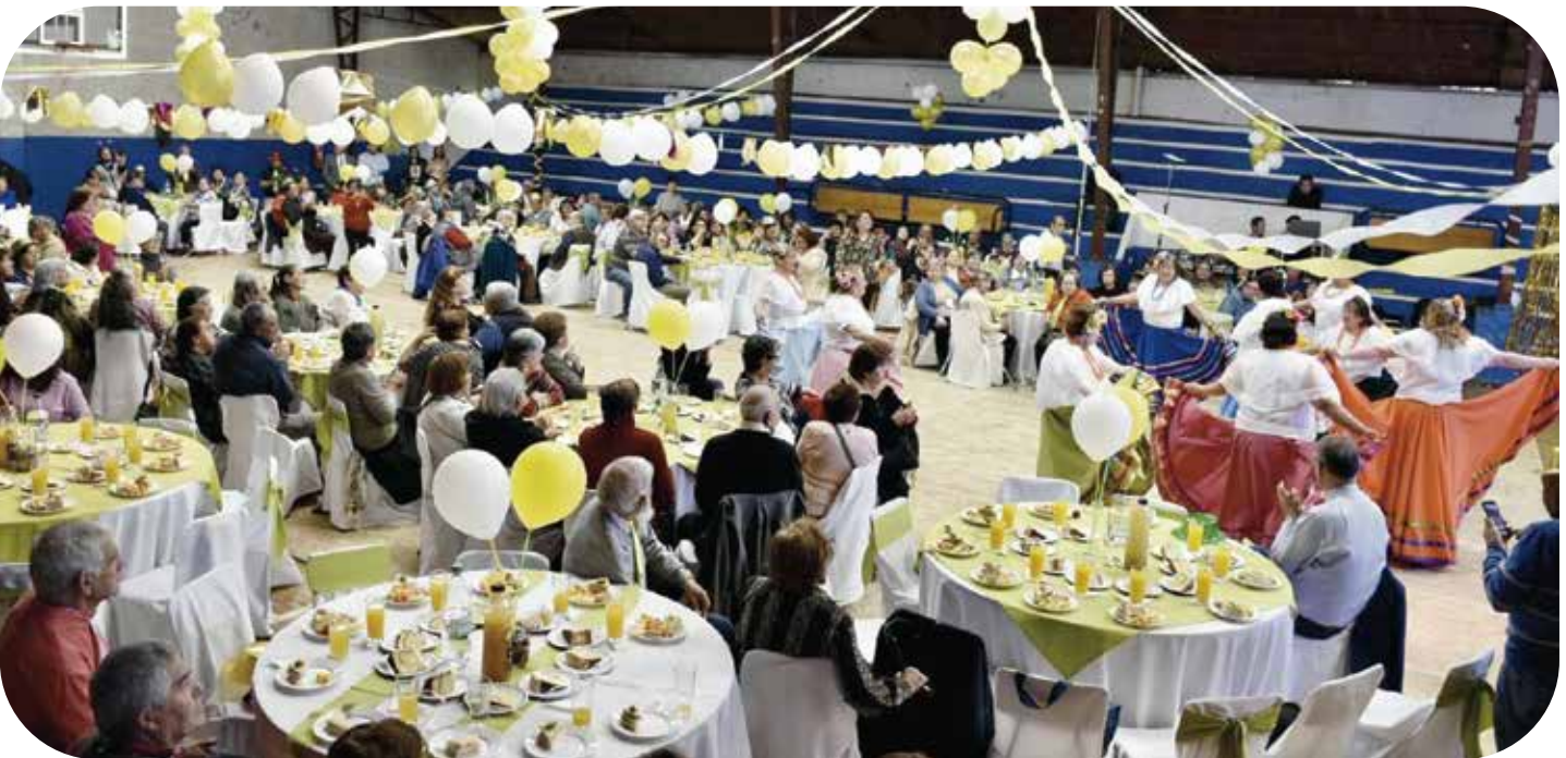
Celebración día del adulto mayor