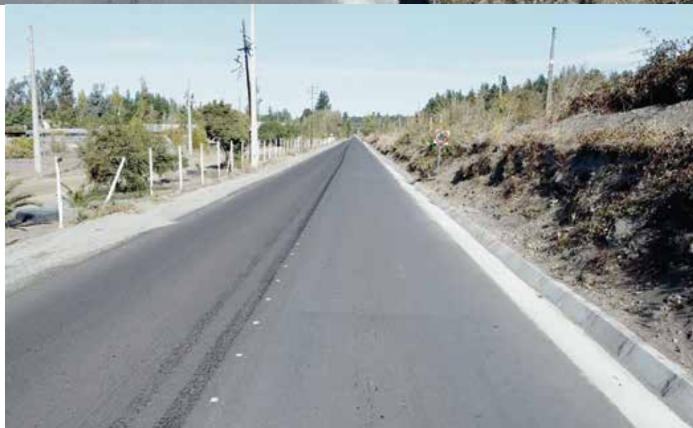
Mejoramiento trazado Río Claro – Turquía (puente Tricauco) MOP VIALIDAD