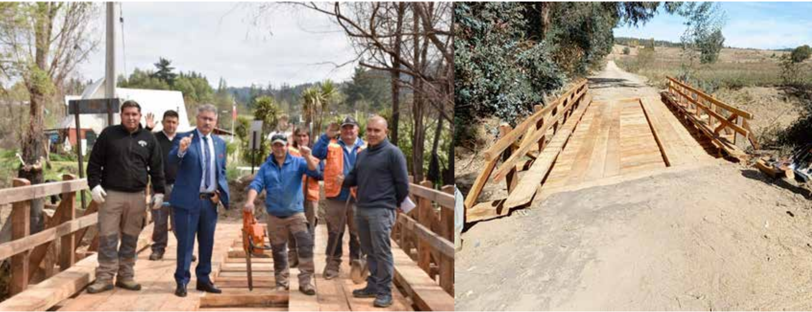
Construcción baños públicos sector centro, Yumbel.