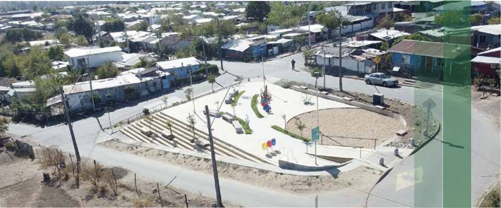
Mejoramiento área verde en población Héctor Dávila Programa Recuperación de Barrios MINVU