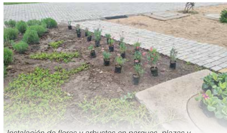
Instalación de flores y arbustos en parques, plazas y paseo peatonal, financiado con recursos municipales