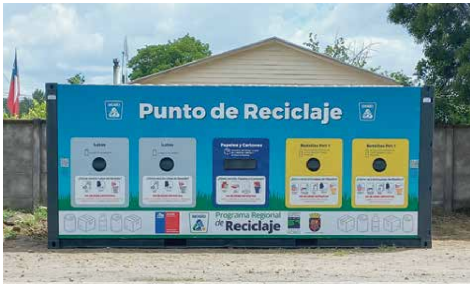
Punto de reciclaje instalado en calle Rozas de Estación Yumbel (frente al estadio)