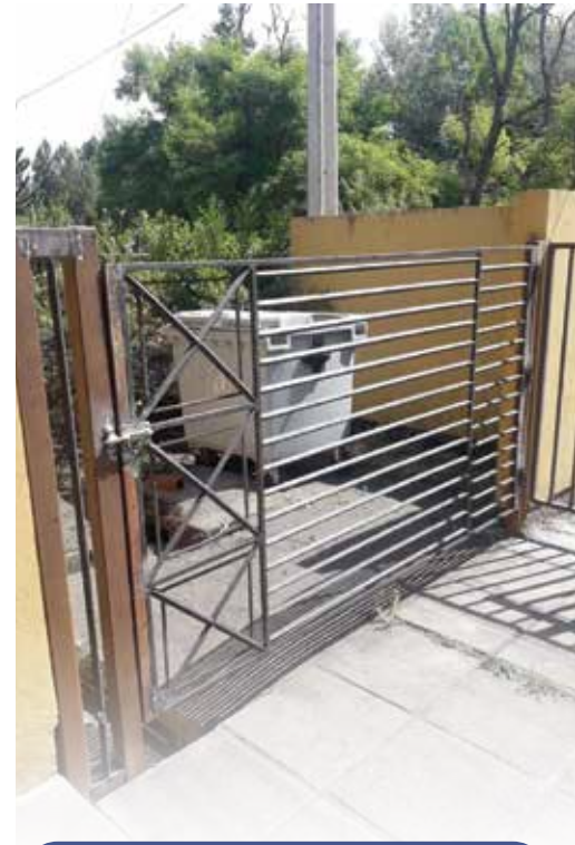
Portón acceso escuela Enrique Puffe La Aguada