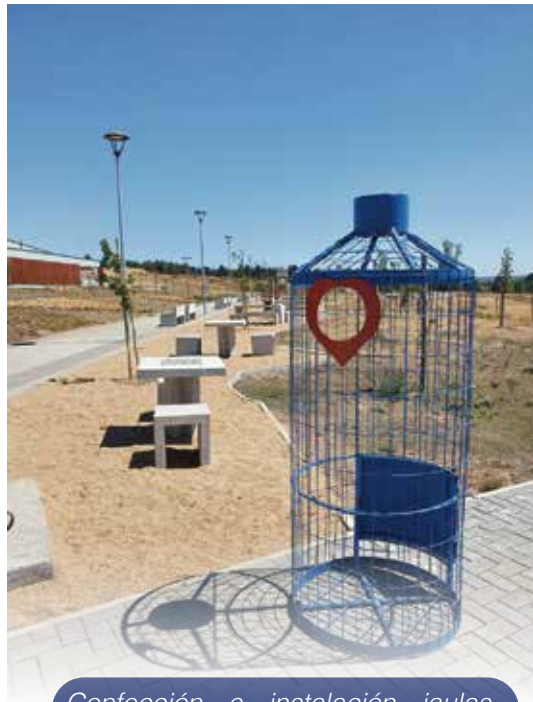
Confección e instalación jaulas para reciclaje botellas PET, financiado con recursos municipales