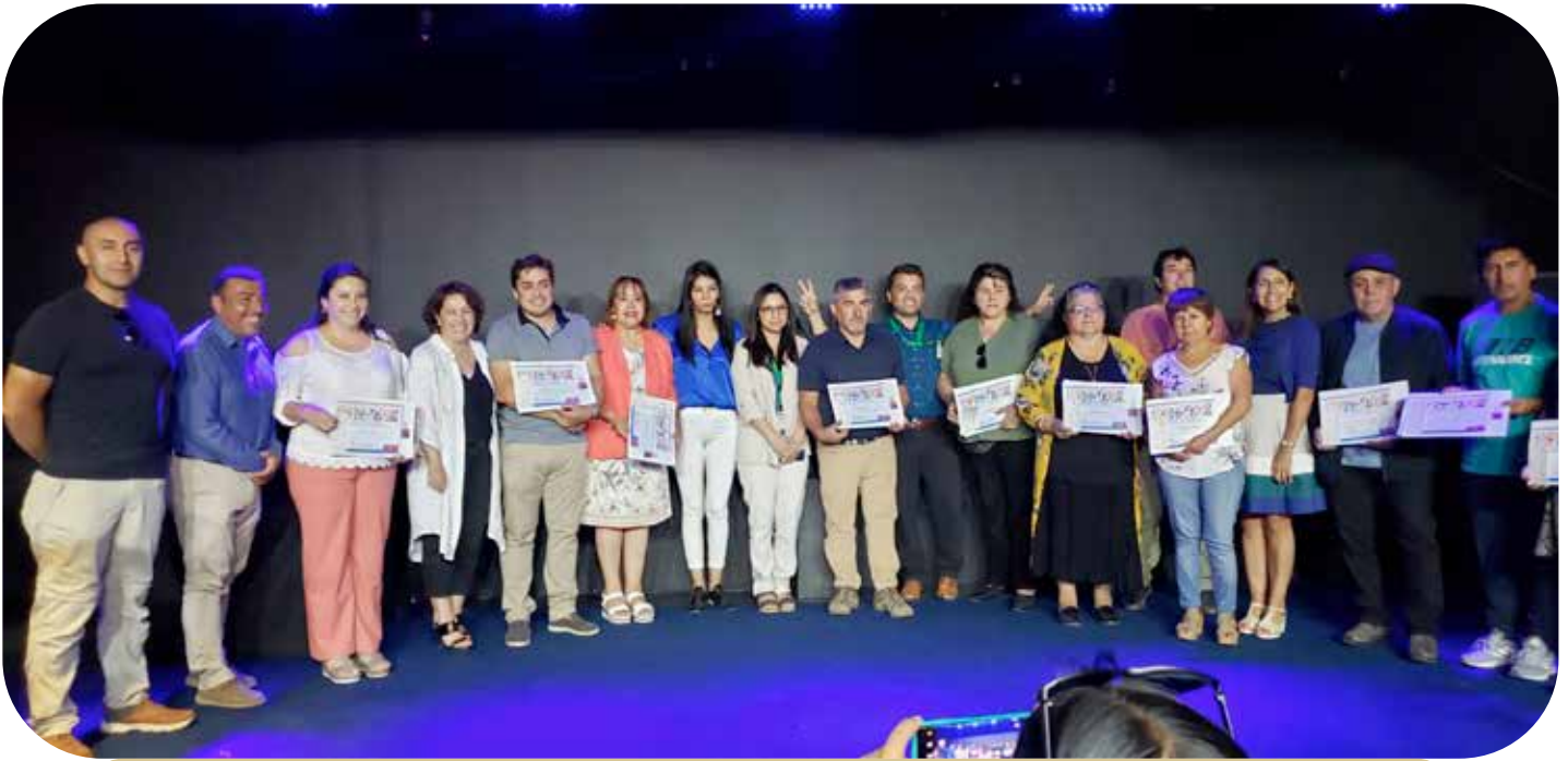
Ceremonia entrega financiamiento FONDESS