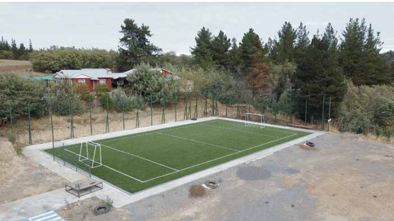
Construcción cancha empastada Tomeco, Yumbel Fondo Regional de Iniciativa Local (FRIL)