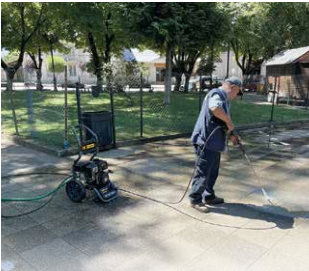
Adquisición Hidrolavadora para la limpieza de baldosas y adocretos de espacios públicos, fondos municipales

través del Fondo Nacional de Desarrollo Regional; Construcción de 11 jaulas metálicas para el depósito de botellas PET; Reducción altura y corte ganchos de 11 árboles emplazados en el interior del estadio municipal de Yumbel, y en conjunto con la Dirección de Obras, realizar posteriormente la reparación de las graderías de dicho recinto deportivo; Instalación de punto de reciclaje en calle Rozas de Estación Yumbel, financiado por el "Programa Regional de Reciclaje"; Eliminación de 7 microbasurales; Fumigación de espacios públicos; Desarrollo de la sexta versión del "Día del Cachureo"; Mantenimiento y operación del parque urbano "Cerro La Virgen"; entre otras diversas actividades. A continuación, se muestra gráficamente algunas acciones desarrolladas durante el año por la unidad de Dasorma: