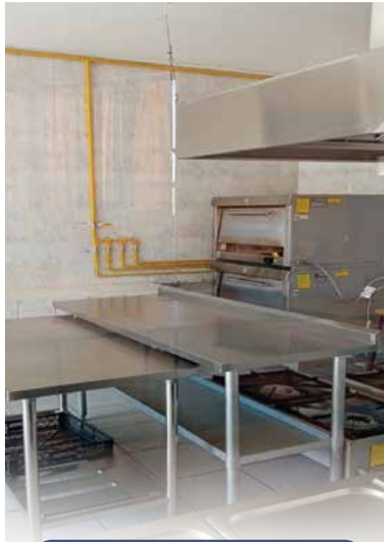
Certificación sello verde para comedores escuela Diego Portales