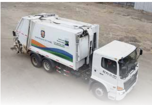
Adquisición camión recolector con alzacontenedor, financiado por el Gobierno Regional del Biobío, a través del FNDR